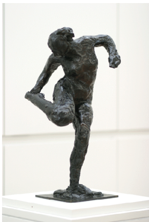
Edgar Degas Dansmey að skoða á sér illina um 1910