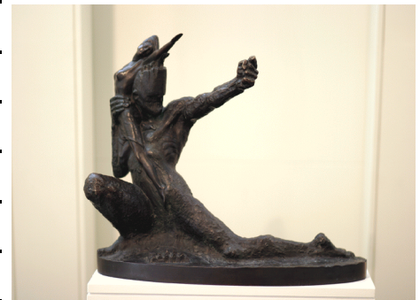
Einar Jónsson Dögun 1906

Hvaða munur finnst þér vera á yfirborði þessarra verka og verka Aristide Maillol og Ásmundar Sveinssonar? Er eitthvað annað ólíkt við verkin? Skoðuðu til dæmis hvort konurnar séu á hreyfingu eða í ró.