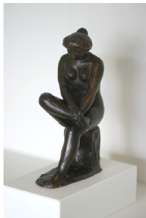
Aristide Maillol Sitjandi kona með krosslagða fætur 1900