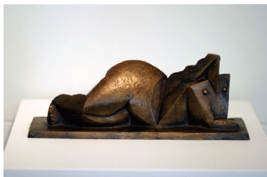
Henri Laurens Liggjandi kona 1921

Skoðaðu önnur verk á sýningunni og reyndu að finna, og skrá hér, þau verk sem þú sérð að bera greinileg geómetrisk form.