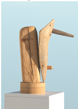
Langt nef LSÓ 157 Í netskránni er hægt að fara „hringferð“ í kringum myndina

Lögð er áhersla á að uppfæra allt sem við kemur einstökum listaverkum, hvort sem er innan safns eða utan, í spjaldskrá safnsins og eru þær upplýsingar færðar inn á netskrána eftir því sem tími leyfir. Á árinu tókst að bæta við ljósmyndum af nokkrum verkum í net-listaverkaskránni. Þá var einnig bætt þar við hringferð ljósmynda af völdum lista- verkum, í tengslum við verkefni fyrir grunnskólabörn.