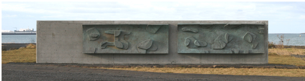
Lágmyndir Sigurjóns, LSÓ 085 og 086, komnar á vegg við safnið í október 2010

Þann 3. júní 2010 varð það óhapp að drengur sem var í vettvangsferð um Laugar-nes með bekkjarfélögum og kennurum úr Álftamýrarskóla felldi myndina Jafnvægi (LSÓ 1332) af stalli sínum svo hún brotnaði. Safnið reyndi að fá skólastjóra Álftamýrarskóla til að miðla málum við foreldra drengsins í þeim tilgangi að heimilis-trygging fjölskyldunnar tæki þátt í viðgerðum á verkinu. Skólastjóri neitaði ábyrgð og vildi ekki gefa upp nöfn foreldra. Steinsmiðjan Rein gerði við verkið og setti á stall 4. maí 2011 - á kostnað safnsins. Allt frá 1992 taldi LSÓ verkið vera eign Reykjavíkurborgar, er þáverandi borgarstjóri, Markús Örn Antonsson, veitti safninu sérstakt fjárframlag, en forstöðumaður Listasafns Reykjavíkur, Hafþór Yngvason, afsalaði sér rétti til myndarinnar, þannig að nú er hún skráð eign LSÓ.