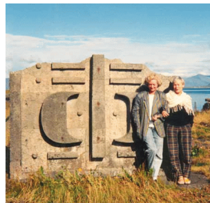
Lágmynd LSÓ 039

Sótt var um styrk til Safnasjóðs 2011 til að ylja gangstéttar safnsins og hlaut safnið um fjórðung af því sem talið er að verkið kosti. Reynst gæti erfitt að nýta það fé nema með verulegu mótframlagi safnsins.