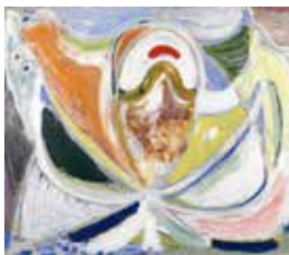
Svavar Guðnason. Íslandslag / Iceland's Melody , 1944