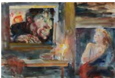
Ásgrímur Jónsson. Nátttrölllið | The Night-Troll , 1950-55

Violin Power I is Steina's first autonomous work, shown in the early days at The Kitchen , a gallery/theatre/laboratory run by Steina and her husband Woody Vasulka in what had been a kitchen in the basement of the Broad- way Central Hotel in New York. She made the work in 1970–78. In this autonomous work we can observe Steina's development as an artist, from playing the violin in her youth and dancing in later years, to singing along to the Beatles' Let it Be as a stoical, mature artist.