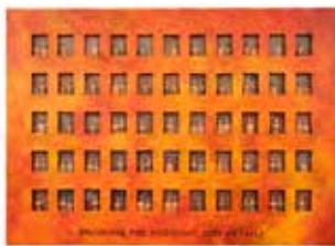
Hulda Hákon, ENJOYING THE MIDNIGHT SUN (DETAIL) | Í miðnætursól (hluti), 2016.